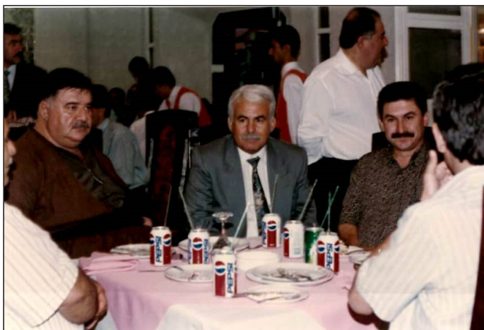
وینه‌یه‌کی یادگاری له‌گه‌ل چه‌ند که‌سایه‌تییه‌ک