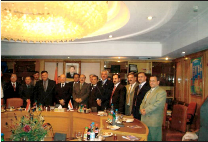
وینه‌یه‌کی یادگاری له‌گه‌ل چه‌ند که‌سایه‌تییه‌ک