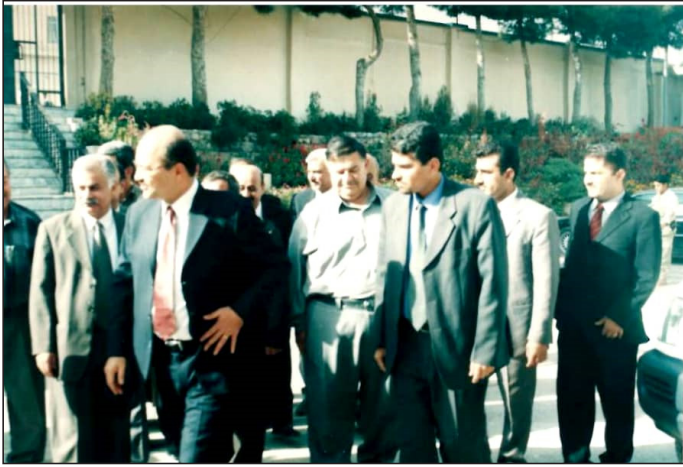
وینہ‌یہ‌کی یادگاری لہ‌گہ‌ل چہ‌ند کہ‌سایہ‌تیبہ‌ک