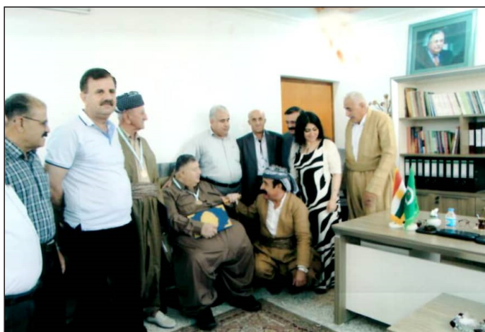
بایز تاله بانى له دهزگای چاودیری دارایی