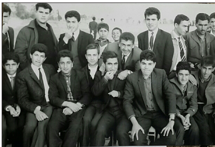
ئاماده‌یی هه‌ولێری کوران