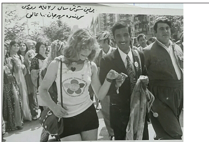
روژی کردنه وهی فیسټیټالی لاوان له بهرلین ۱۹۷۳