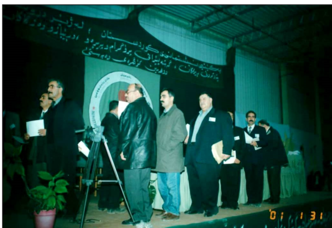
شیخ بایز له کونگره‌ی دووی یه‌کیتیی نیشتمانیی کوردستان