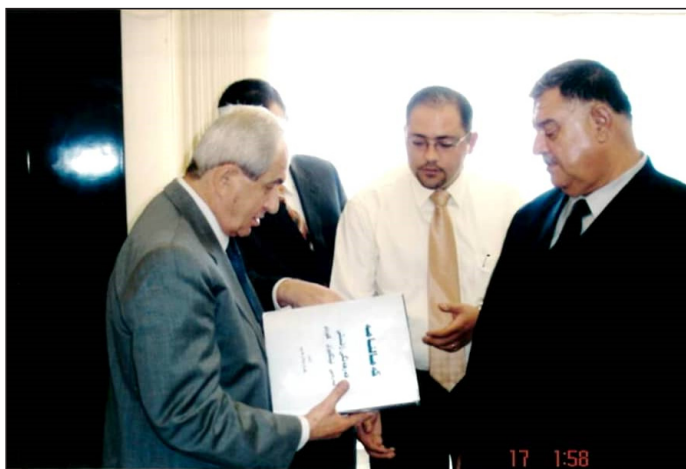
بایز تاله بانى له کاتى گفتوگو و رایى کردنى کارهکاندا