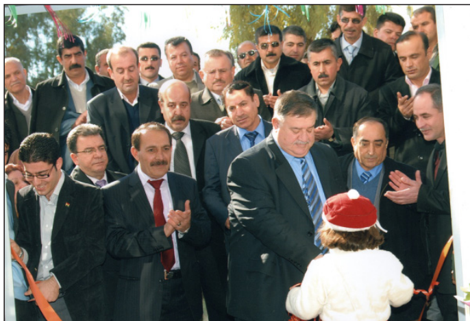
به ریو به ریٹی گشتی بانکی هه ریتم / هه ولیر