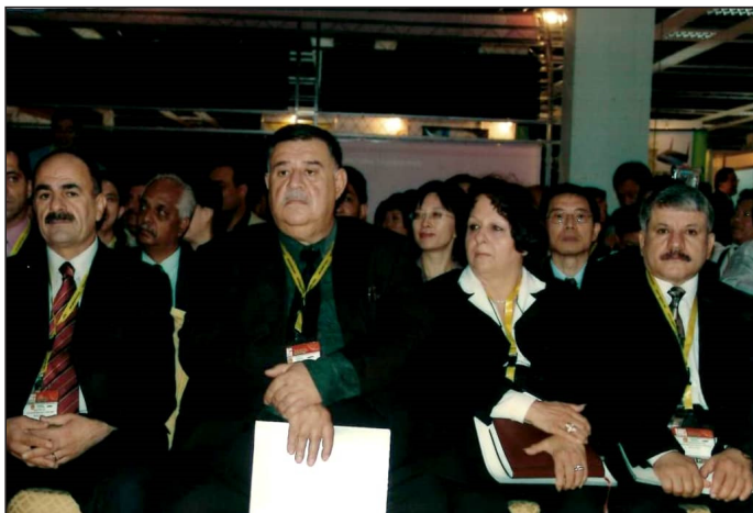
به‌رئزان محهمهه كه‌ریم، شیخ بایز، حاكم قادر