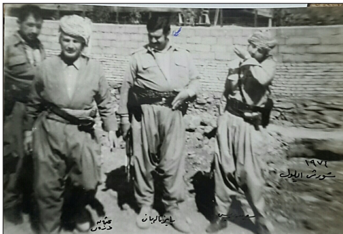
سه رده می پیشمه رگایه تی شورشی ئه یلول