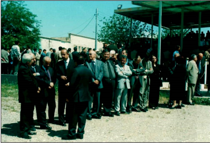
وینه‌یه‌کی یادگاری له‌گه‌ل چه‌ند که‌سایه‌تییه‌ک