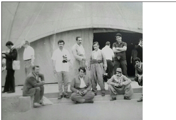
فیسټیټالی لاوان له بهرلین ۱۹۷۳