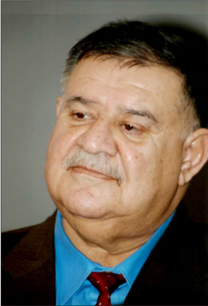
شیخ بایز تاله‌بانی