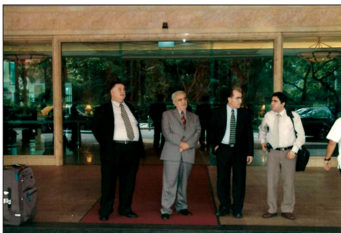
به پریز عومه ر فهتاه و شیخ بایز له ولاتی ئه لمانیا