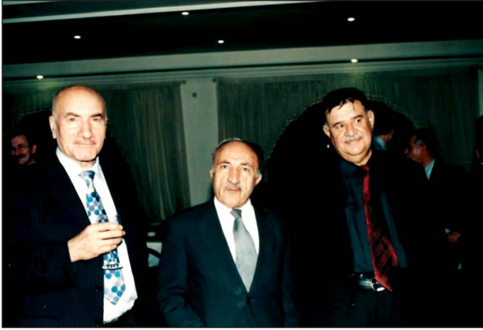
شیخ بایز، دکتور مه‌حمود عوسمان