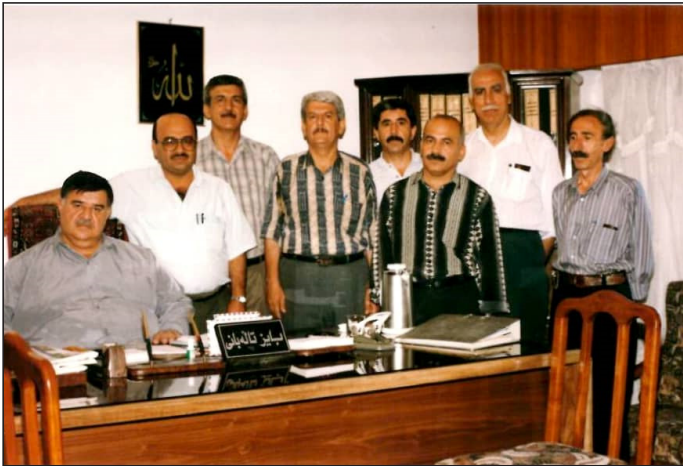
وینہ‌یہ‌کی یادگاری لہ‌گہ‌ل چہ‌ند کہ‌سایہ‌تیبہ‌ک