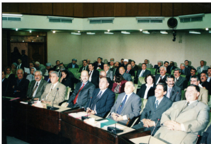
ئاماده‌بوونی شیخ بایز له کۆبوونه‌هی فه‌رمی حکومهت