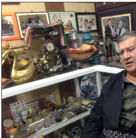
شیخ بایز و مؤزه‌خانه‌کھی