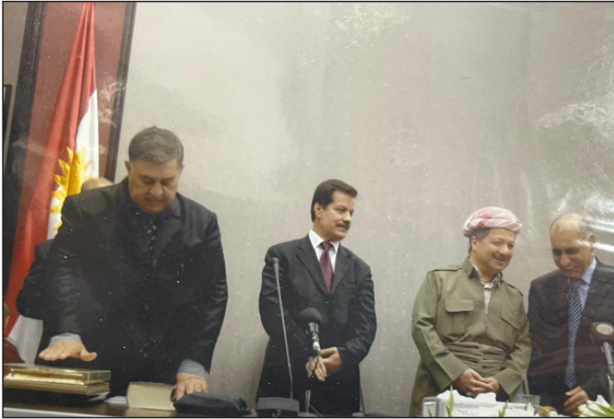
سویندخواردنی شیخ بایز بۆ وه‌زیری هه‌ریم بۆ کاروباری دارایی