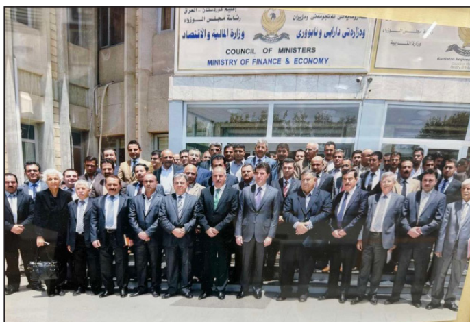
سهردانی بهریز نیچیرقان بارزانی سهروکی حکومتی ههریم بق وهزارهتی دارایی