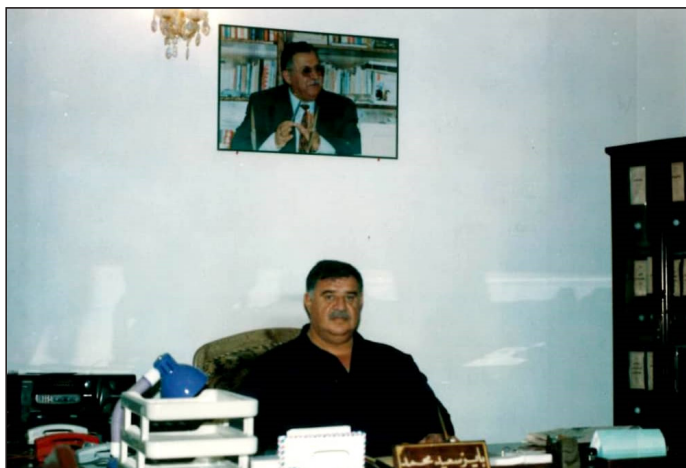
شينخ بايز له باره گاي ده زگاي چاوديري دارايي