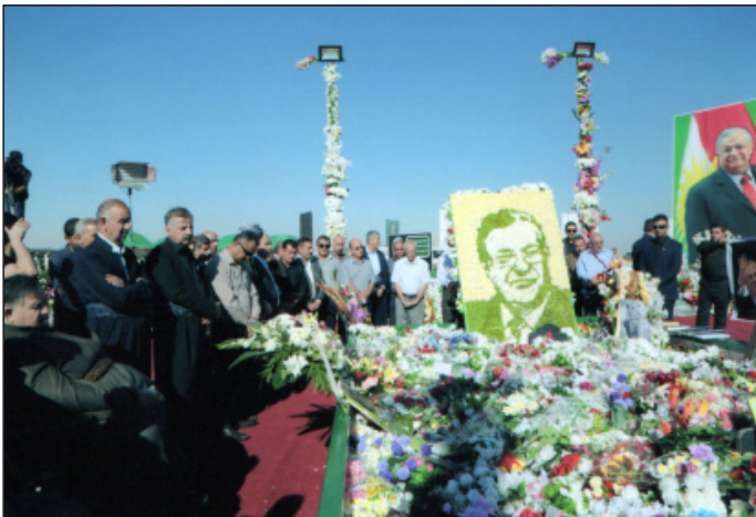
سه‌ردانی ده‌زگای چاودیری دارایی بۆ مه‌زاری مام