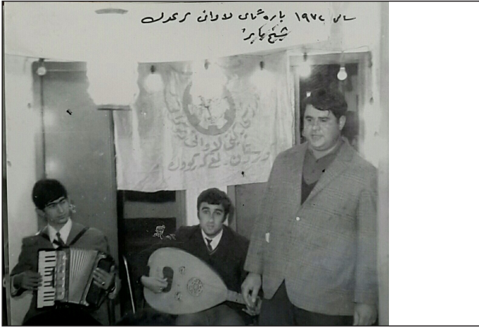
شیخ بایز، ۱۹۷۲ باره‌گای لاوانی که رکوک