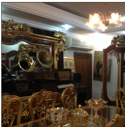
وینہیہ کی یادگاری