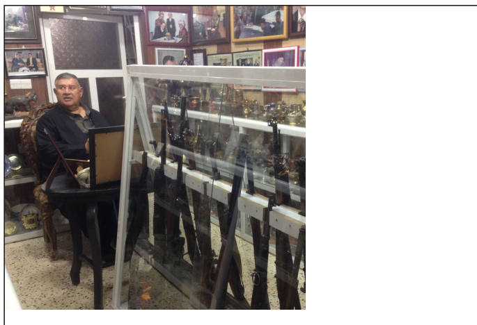
شیخ بایز و موزه خانه که ی