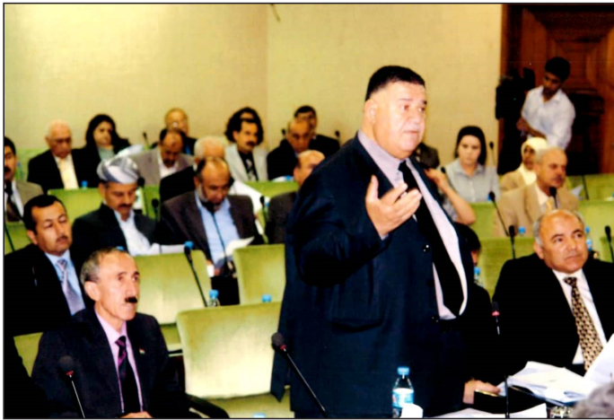
بایز تاله‌بانی له په‌رله‌مانی کوردستان