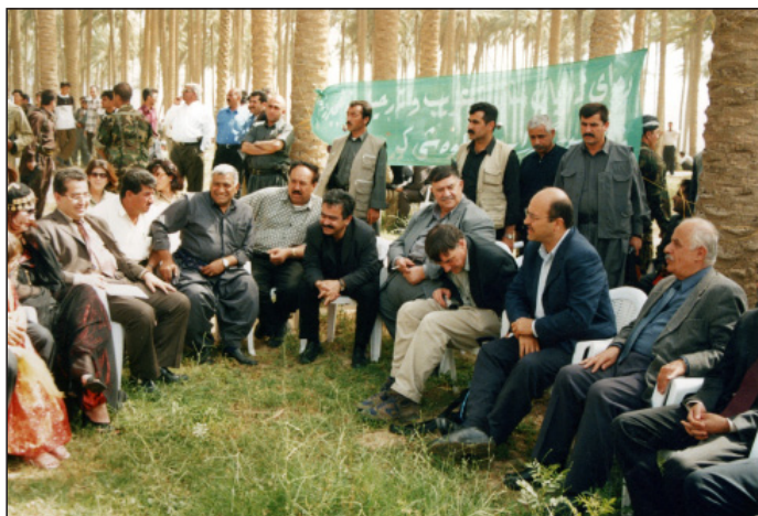
کردنه‌وه‌ی یانه‌ی وهرزشی که‌رکوک