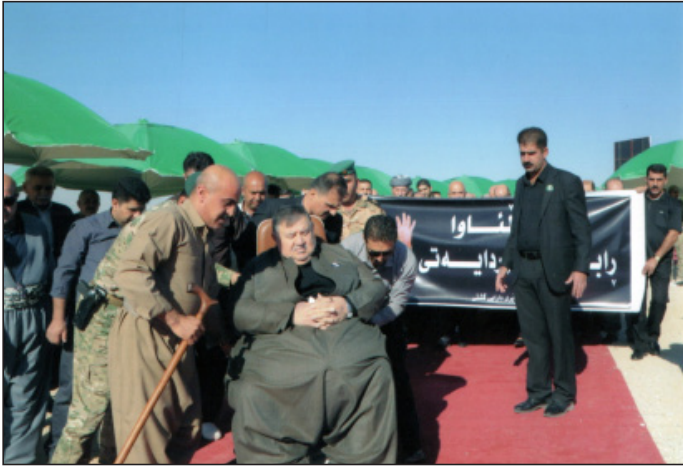
سه‌ردانی شیخ بایز بو سه‌ر مه‌زاری مام جه‌لال