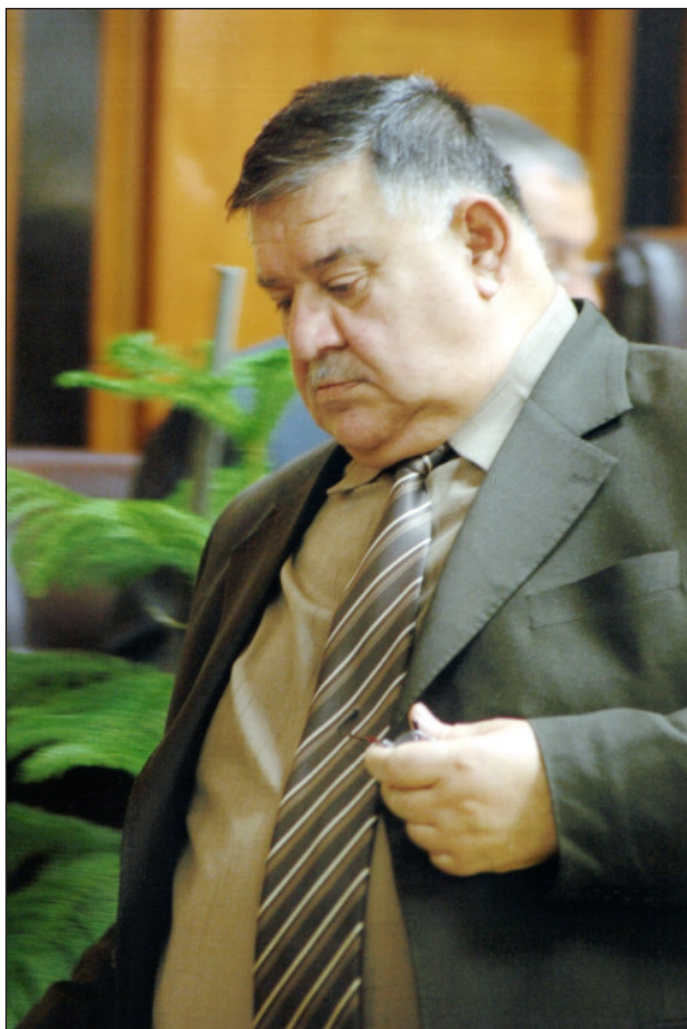
شېخ بايز تالهبانى