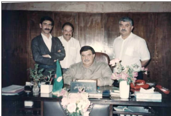
وينه يه كي يادگاري له گه ل چه ند كه سايه تيبه ك