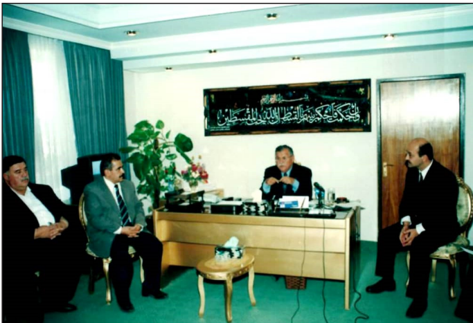
به‌پیزان دکتور به‌ره‌م سالج، مام جه‌لال، شیخ بایز