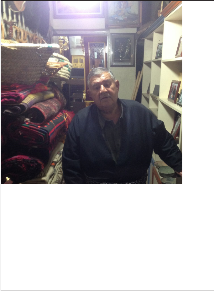
شیخ بایز و مؤزه‌خانه‌که‌ی