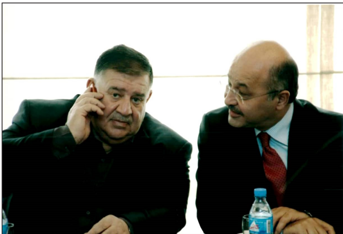
دکتور به‌ره‌م س‌ال‌ح و شیخ بایز تاله‌بانی