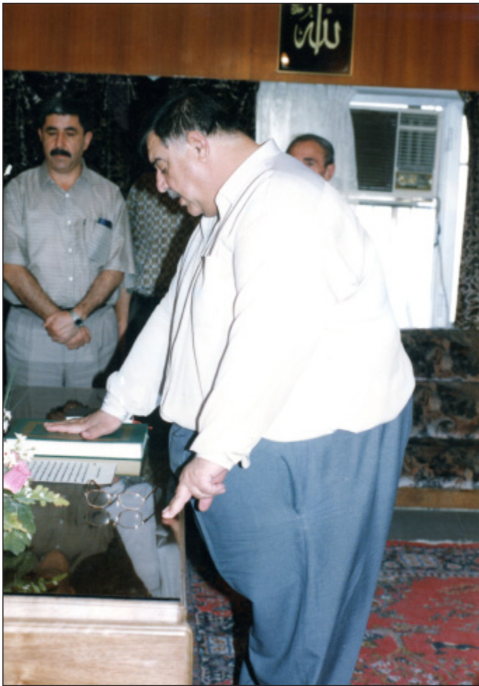
سویندخواردنی شیخ بایز دیوانی چاودیزی دارایی