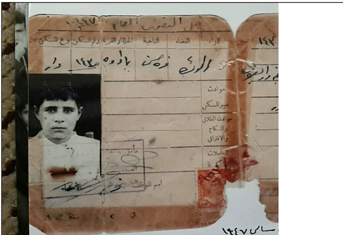
وینه‌یه‌ک له ره‌گه‌زنامه‌ی شیخ بایز