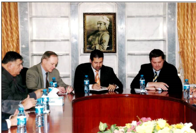
به‌رئز کاک قوباد له کۆبونه‌وه‌ی وه‌زاره‌تی دارایی