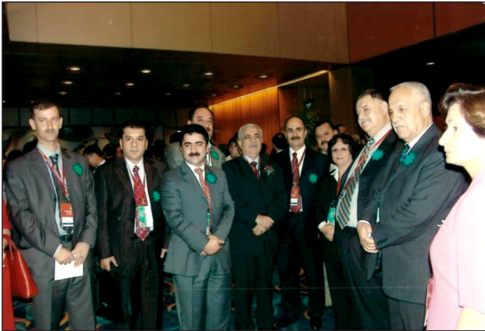
وینهبه‌کی یادگاری له‌گه‌ل چه‌ند که‌سایه‌تیبه‌ک