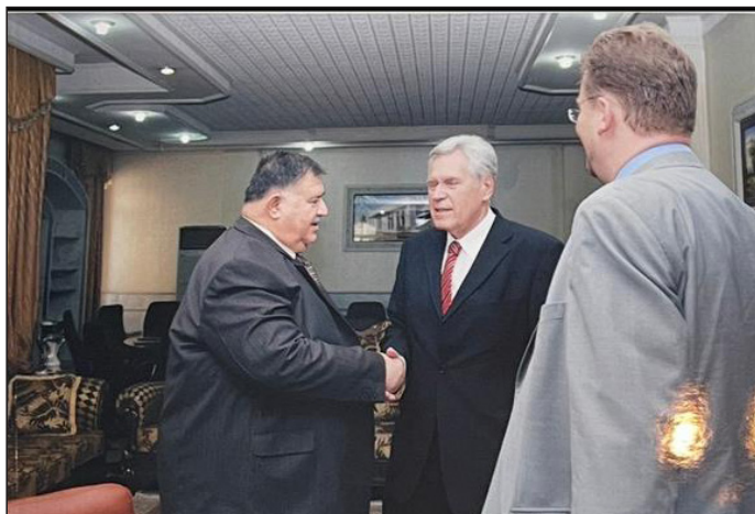
پیشوازی کردن له وهفد و کهسایه تییه بیانیه کان