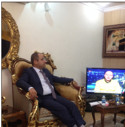
وینہیہ کی یادگاری