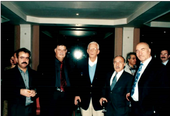
وینه‌یه‌کی یادگاری له‌گه‌ل چه‌ند که‌سایه‌تییه‌ک