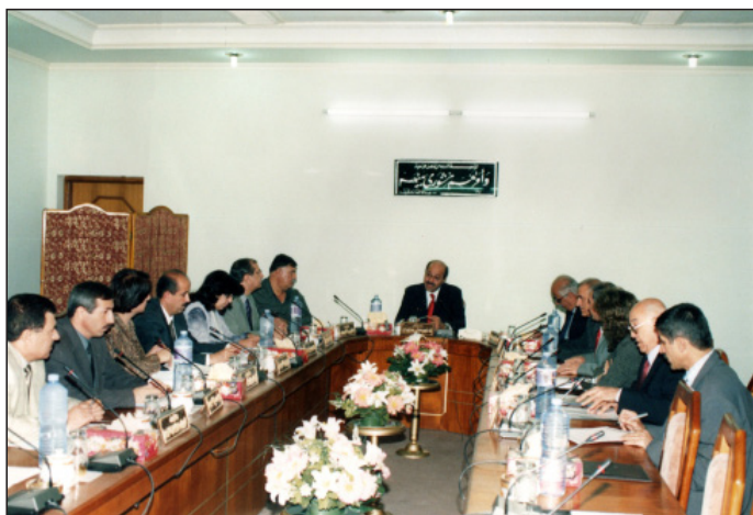
کۆبوونه‌وه‌ی ئەنجومه‌نی وه‌زیران